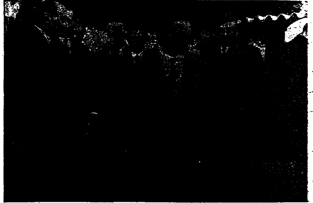
جلالة الملك المظفر ادى وصوله الى دار رئاسة الوزراء وفي استقبال جلالته السيد بهجت التلهوني رئيس الوزراء والوزراء (التصوير و.ا.ا.)

القبض - ( خاص بالمشور ) قابل السيد روهي الخطيب امين القديس واعضاء مجلس الامة الذين رفضوا التعاون مع سلطات الاحتلال الاسرائيلي بعد الحرب ، فاقبلوا الاسبوع الماضي على الجلاء الى الضفة الغربية للاحتجاج على الاجراء الذي اتخذته سلطات الاحتلال والقاضي بصدارة مساحات واسعة من الاراضي العربية لاقامة اية ومساكن عليها للمقاتلات اليهودية . وشملت هذه المقاتلات قنصل فرنسا وبريطانيا والولايات المتحدة وتركيا وايطاليا واليونان واسبانيا ذلك برغم ان مثل اسبانيا ليس له وضع قانوني في اسرائيل على اسس ان اسبانيا لا علاقات دبلوماسية بينها وبين اسرائيل وقد صرح السيد الخطيب للصحفيين البقية على الصفحة الخامسة عمود ١